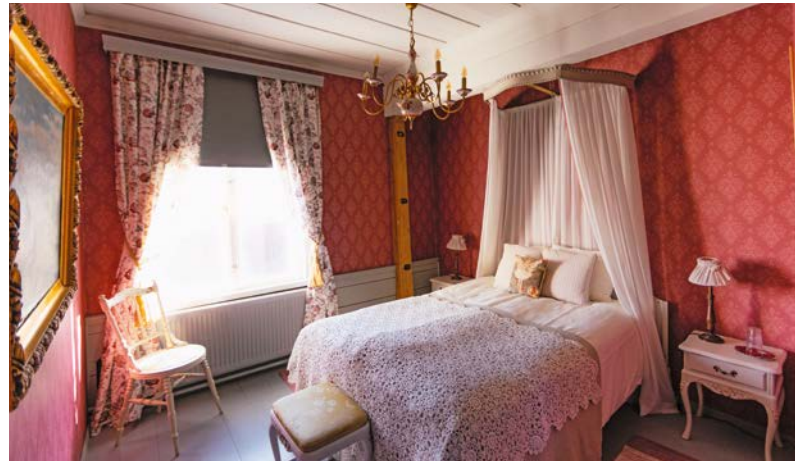
Puppenstuben-Feeling im Langi Handelshaus in Raahe, wo sich auch das Pakkahuone Museum und der Kinosalon Sofia befinden

Oula Kitchen & Bar Am Wochenende stehen die Einwohner hier Schlange, um einen Laib