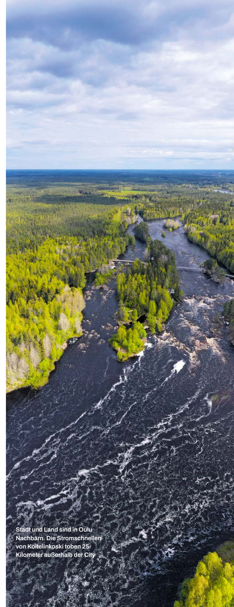
Stadt und Land sind in Oulu Nachbarn. Die Stromschnellen von Koitelinkoski toben 25 Kilometer außerhalb der City