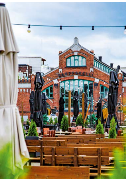
Von oben links im Uhrzeigersinn: Oulus Stadttheater, Entstehung eines Murals im Rahmen des Kulturhauptstadtprogramms, das Pakkahuone-museum in Raahe, das unter anderem Seemannsouvenirs zeigt, die Bar Mallasterassi, die ehemaligen Lagergebäude am Marktplatz, Austausch im Ouluer Kunstmuseum, Entspannung auf der Saunafähre und die historische Markthalle